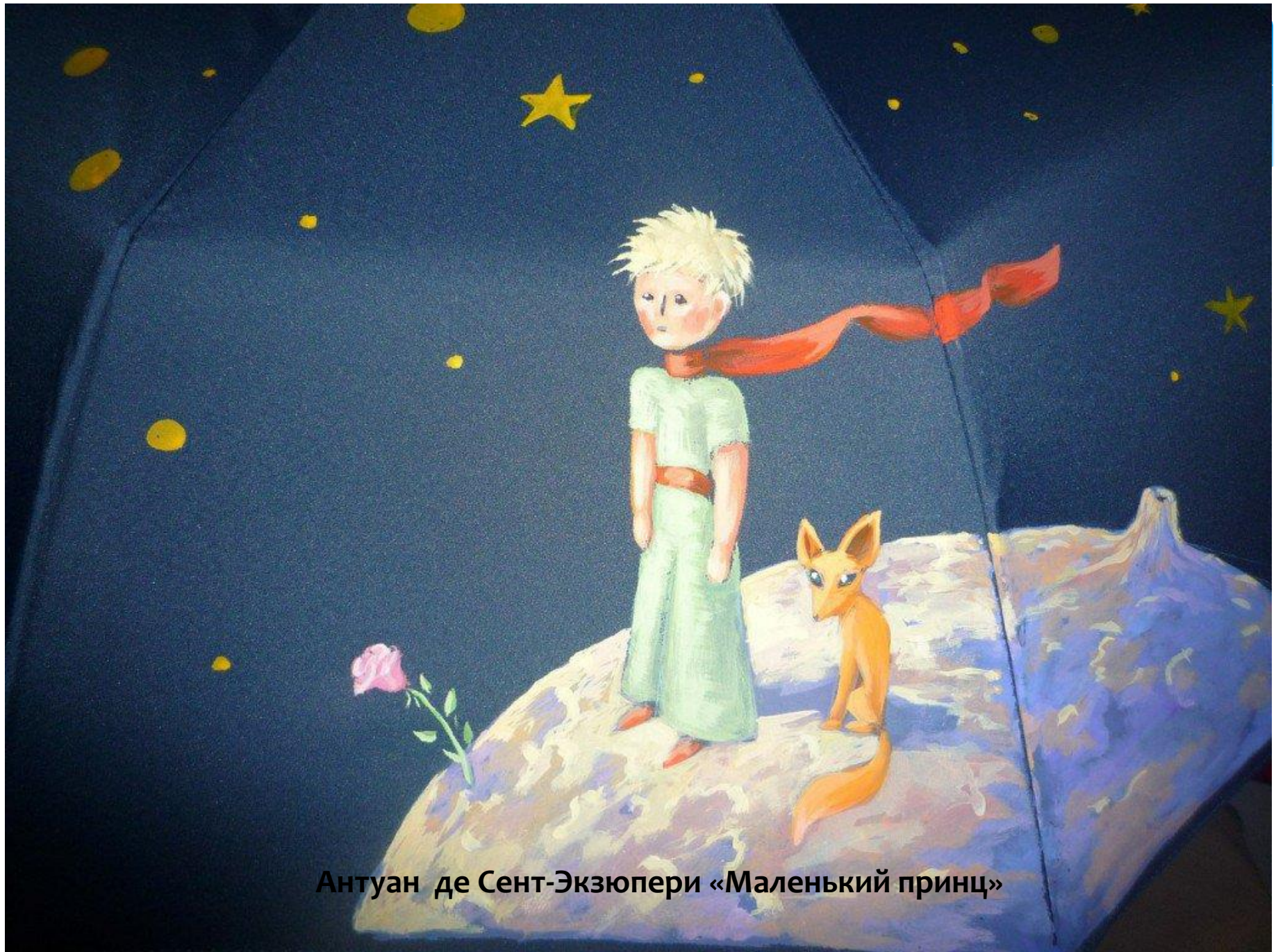
Антуан де Сент-Экзюпери «Маленький принц»