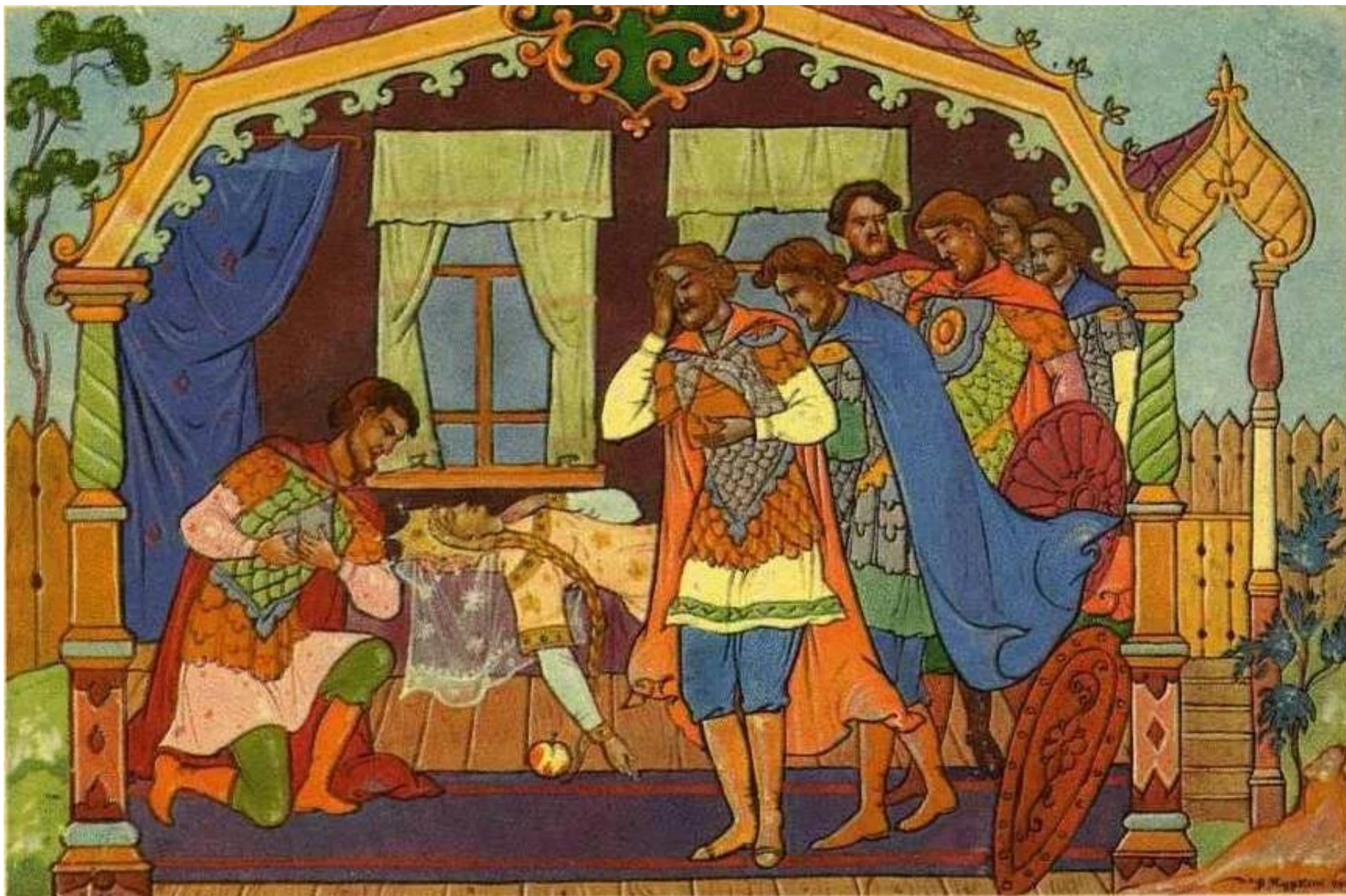
А. С. Пушкин «Сказка о мёртвой царевне и о семи богатырях»