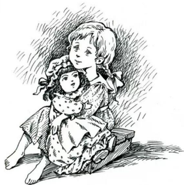
В. Г. Короленко «В дурном обществе»