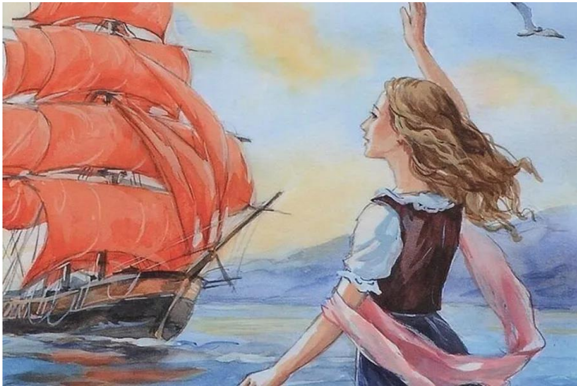
А. С. Грин «Алые паруса»