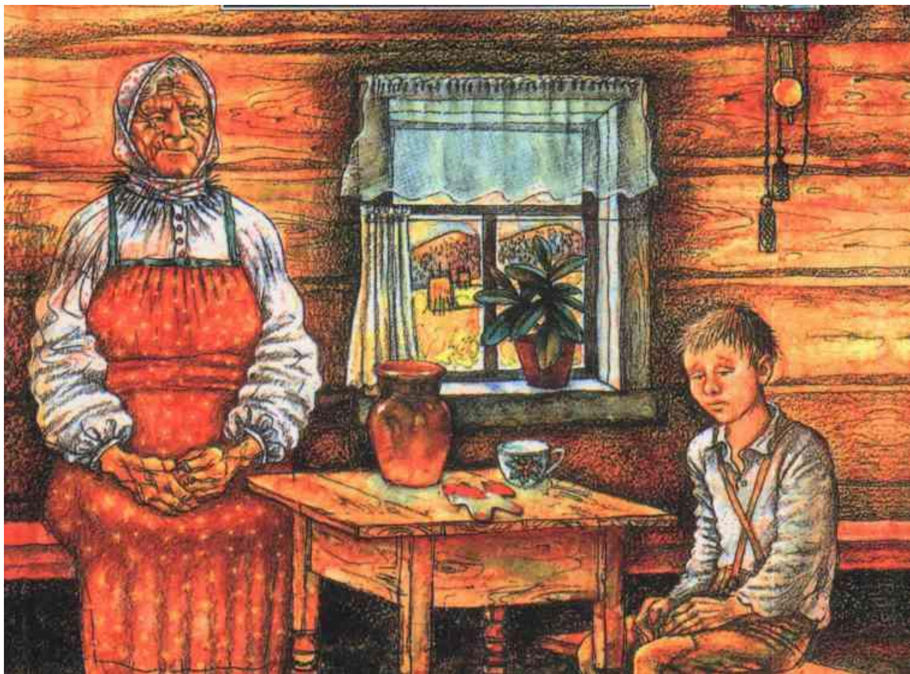
В. П. Астафьев «Конь с розовой гривой»